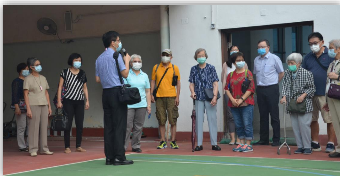
由校長帶領嘉賓參觀學校的新設施