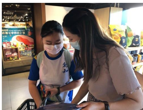
同學與社工有商有量