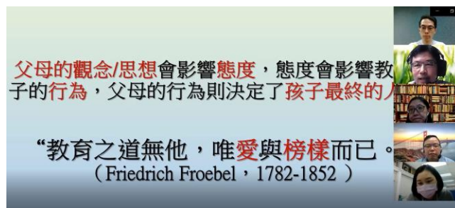
校長分享教育之道