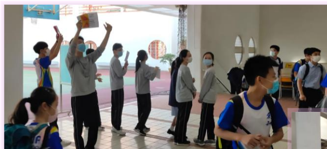
候選內閣 Echo 和 Utopia 拉票