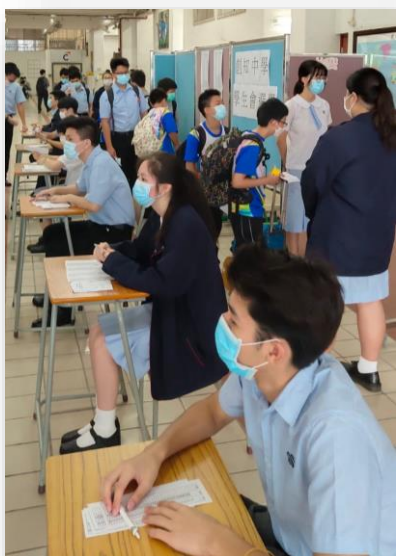
學生會選舉投票情況