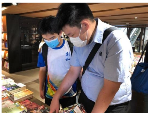
同學正聚精會神選書