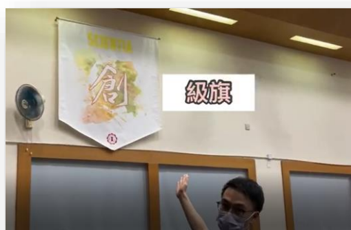
輔導組迎新片段的掠影