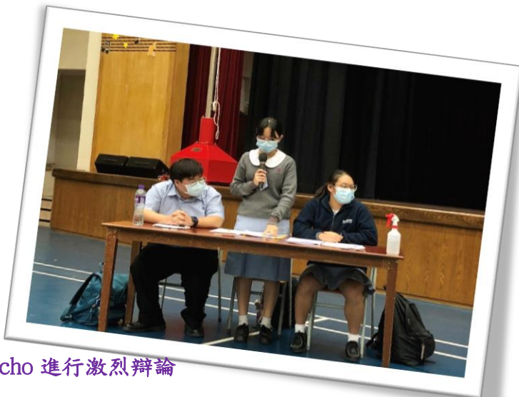
候選內閣 Utopia 和 Echo 進行激烈辯論