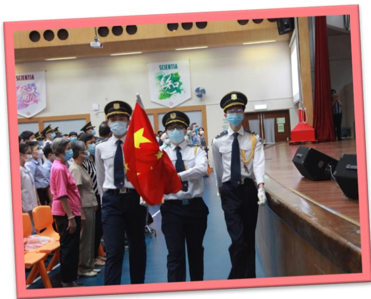
全體教職員工及外賓觀看升旗儀式

2020年9月30日，為慶祝中華人民共和國成立七十一周年及中秋佳節，學校進行了多項特色慶祝活動，為祖國送上美好的祝福。在校內，全體教職員工、退休高齡教工、家長教師會理事先在學校禮堂進行莊嚴的升旗儀式。接著，校長帶領嘉賓參觀學校校舍的最新設施，而同學們則分別在禮堂及311室觀看愛國電影。校方每年所挑選的電影，都會選取一些中國人努力奮鬥，艱苦建立中華人民共和國的故事，希望同學能透過電影欣賞，珍惜得來不易的一切。本年度學校選取的電影是《攀登者》，電影講述了1960年，偉大的中國登山隊，為了國家的使命，衝破艱險成功登頂珠穆朗瑪峰的故事。這部電影有著特殊的紀念意義，因為它是根據真實的事件改編。經過了兩個多小時的時間，同學們都感受到國人不畏艱辛、前仆後繼的精神。此外，本校10位高中同學，當天亦代表學校，出席由香港同胞慶國慶籌委會在香港會議展覽中心舊翼會議廳舉辦的「香江慶國慶、中秋喜團圓」活動，共同慶祝雙節的來臨。（楊明佳主任撰文）